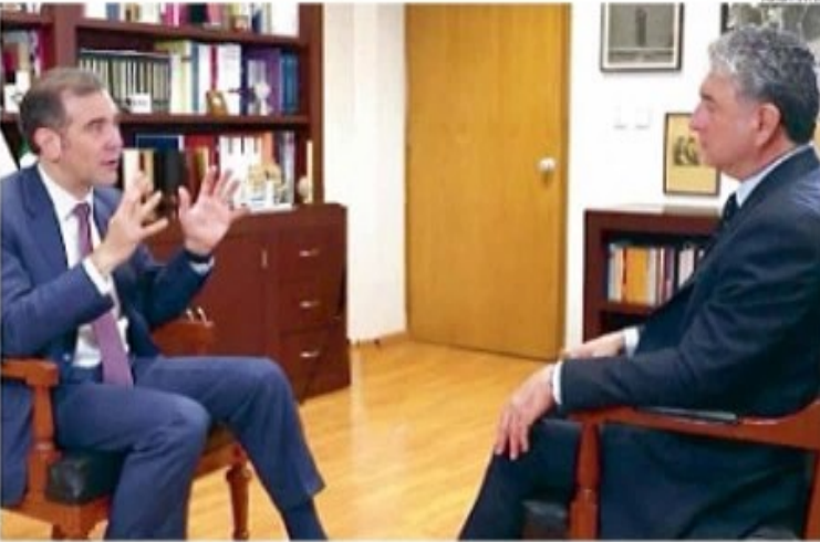
NOVEDAD. El funcionario recordó que la elección local y federal se realizan al mismo tiempo.

EUNTC / 09 / 11 / 2020 NEBAE@EXCMEX.COM.MX